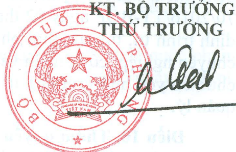
Trung tướng Phan Văn Giang